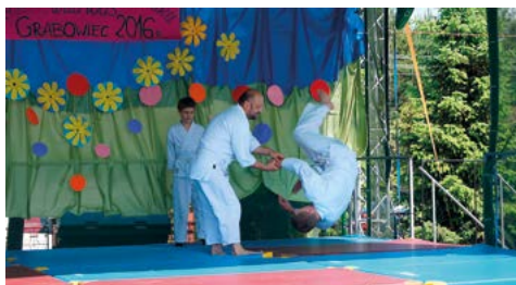
Pokaz sztuki Aikido podczas Pikniku rodzinnego