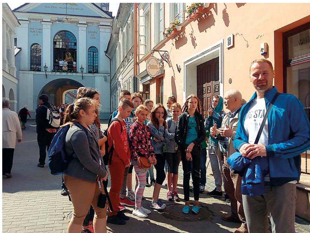
Przed Kaplicą Matki Boskiej Ostrobramskiej w Wilnie – 2016