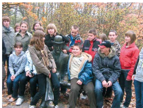
Ławeczka Bolesława Prusa w Nałęczowie