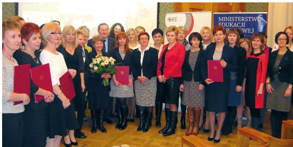
Delegacja szkoły wśród laureatów konkursu