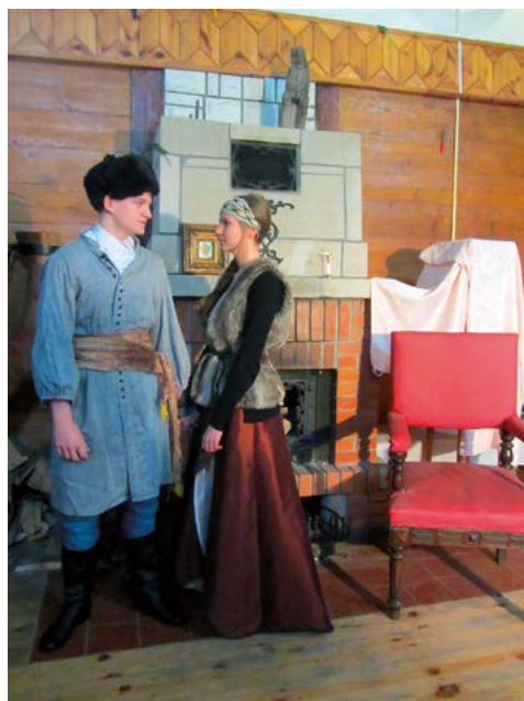
Uczniowie gimnazjum w kostiumach postaci sienkiewiczowskich