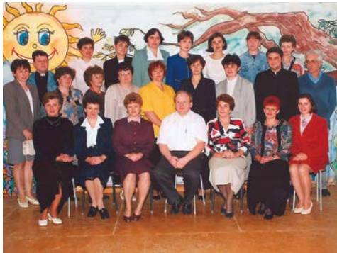
Grono pedagogiczne w roku szkolnym 1997-1998