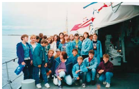
Na pokładzie ORP Błyskawica w Gdyni