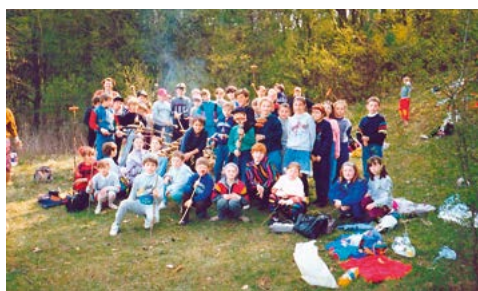
Ognisko w Rogowie