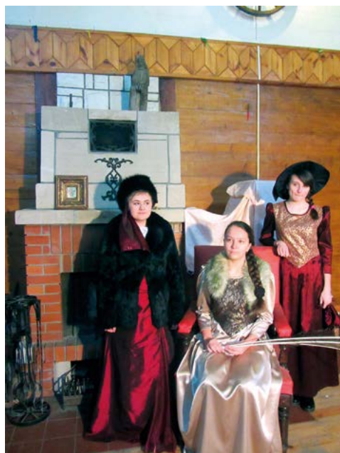
Gimnazjalistki w strojach sienkiewiczowskich