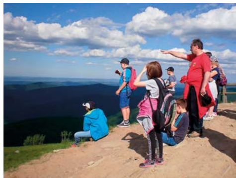
Zdobywcy bieszczadzkiego szczytu