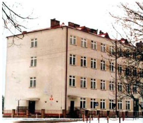
Oddanie do użytku nowego skrzydła szkoły 18 stycznia 1997 r.