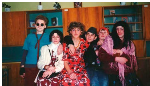
Uczniowie klasy VIII w pierwszym dniu wiosny 1997 r.