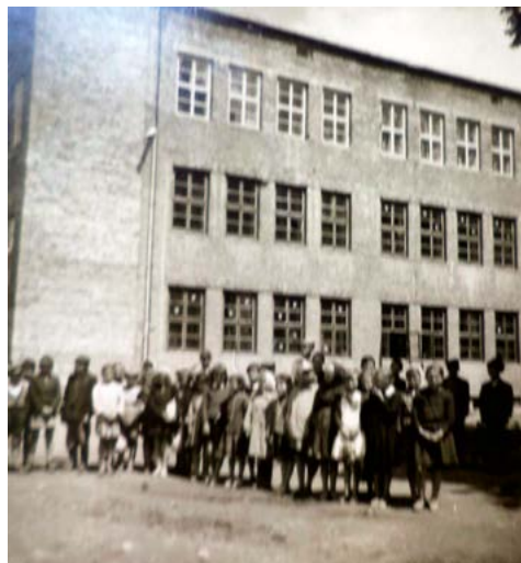
Szkoła w latach 60. XX w.