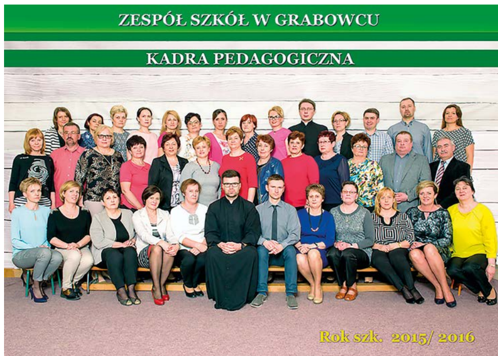
Kadra pedagogiczna w roku szkolnym 2015-2016