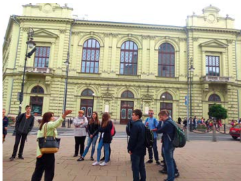
Wyjazd na spektakl Książę i żebrak w Teatrze Juliusza Osterwy w Lublinie