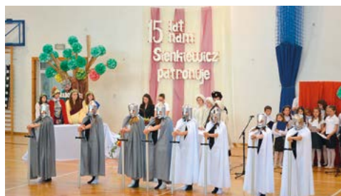
Układ taneczny w wykonaniu gimnazjalistek