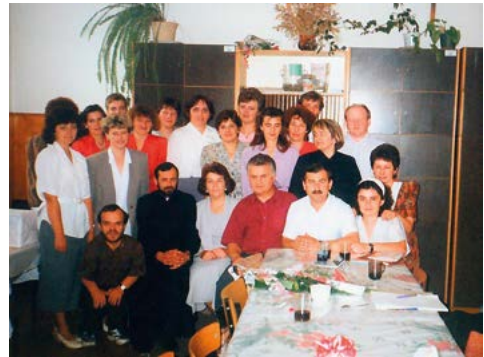
Grono pedagogiczne w pokoju nauczycielskim