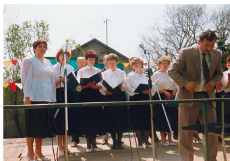
Po zakończonym koncercie w Grabowcu