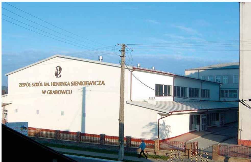
Fotografia szkoły z 2006 r.