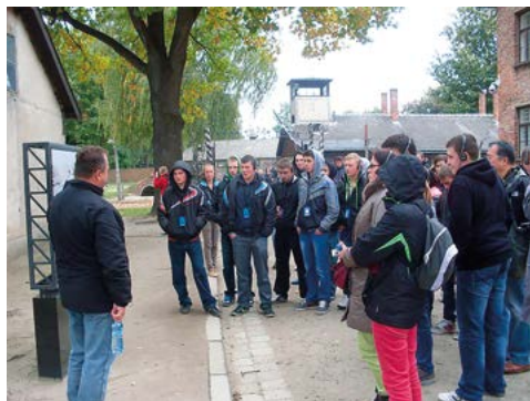
W Muzeum Martyrologii KL. Auschwitz