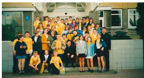
Wyjazd młodzieży na nagranie do programu Ziarno w Telewizji Polskiej