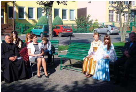
Narodowe Czytanie Sienkiewicza – wrzesień 2014 r.