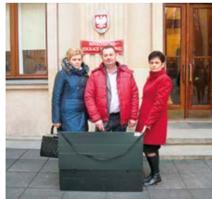
Delegacja szkoły przed gmachem Ministerstwa Edukacji Narodowej