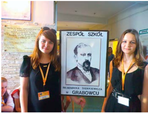
Delegacja szkoły w Bydgoszczy – 2014 r.