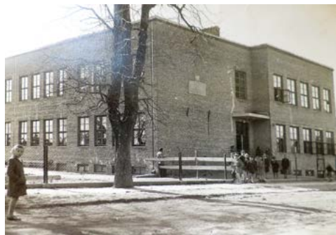
Fotografia szkoły z lat 50. XX w.