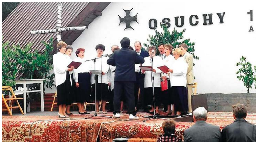
Występ Chóru w Osuchach w 1994 r.