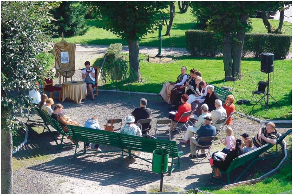
Narodowe Czytanie Sienkiewicza – 2014 r.