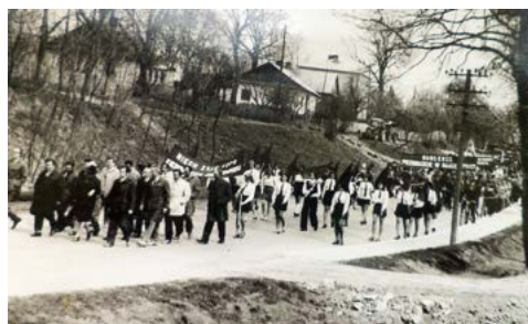
Pochód pierwszomajowy w latach 70. XX w.