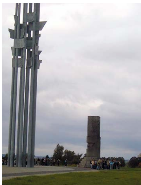
Na polach Gunwaldu w 2007 r.