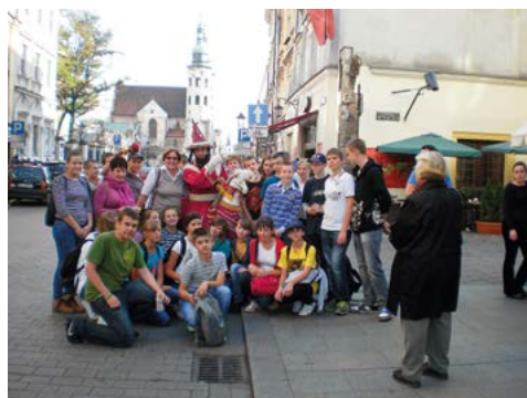
Na krakowskim Rynku