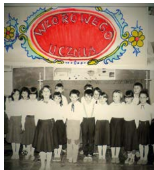
Wręczenie tarcz wzorowego ucznia