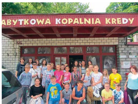
Zwiedzanie podziemi kredowych w Chelmie - 2016 r.