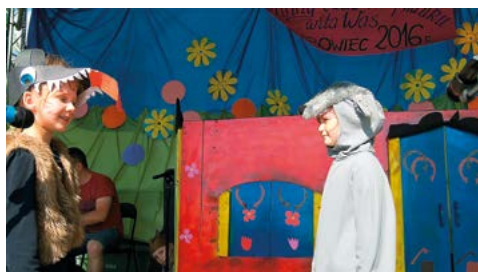
Przedstawienie O wilku i siedmiu kozłkach w wykonaniu grupy teatralnej Promyczki