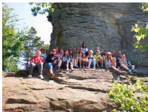
Odoczynek pod bieszczadzką skałą