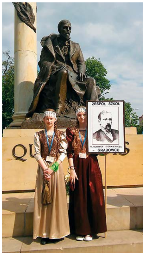
Złot w Kielcach w 2016 r.