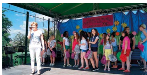
Piknik rodzinny – czerwiec 2016 r.