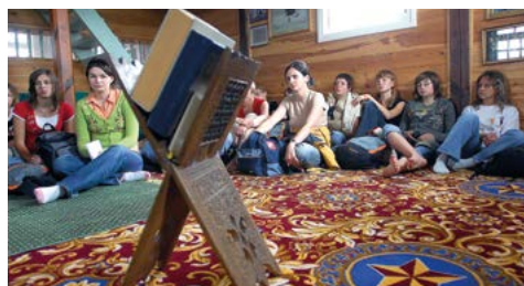
Orange dla Ziemi – wizyta w Meczecie w Kruszynianach