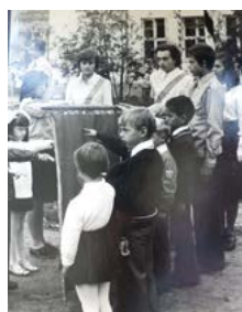
Ślubowanie uczniów klas pierwszych szkoły podstawowej – 1975 r.