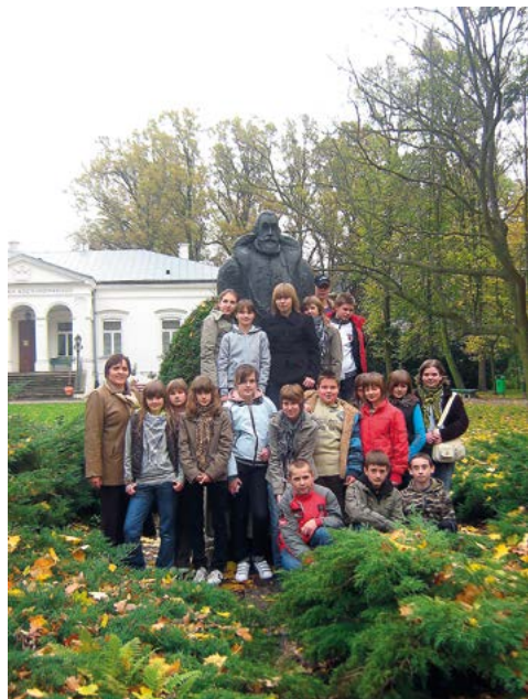
Gościnnie u Jana Kochanowskiego w Czarnolesie