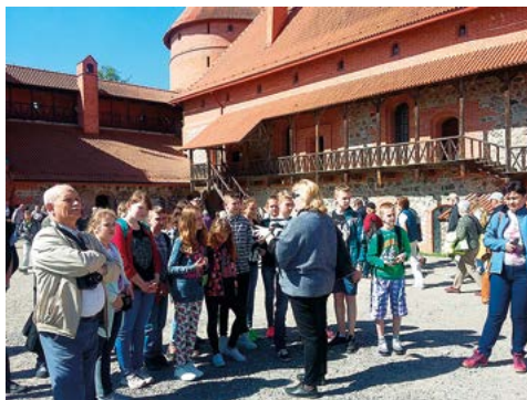
Wizyta na Litwie