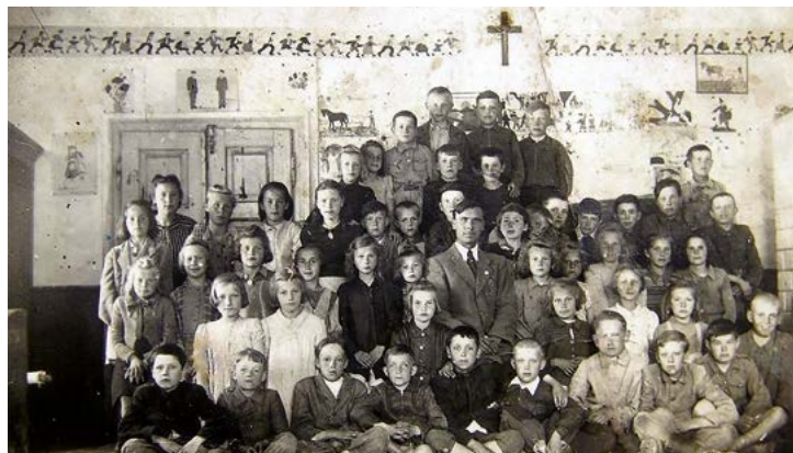
Klasa w tzw. Białej Szkole – foto z lat 30. XX w.