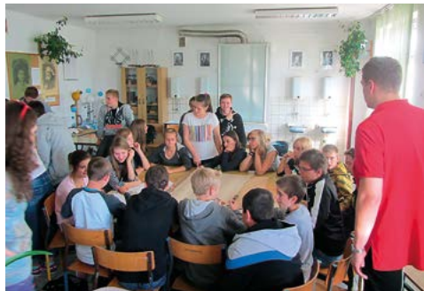
Współpraca uczniów gimnazjum ze studentami Politechniki Warszawskiej