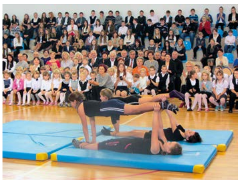
Pokaz umiejętności sportowych w wykonaniu uczniów – 2014 r.