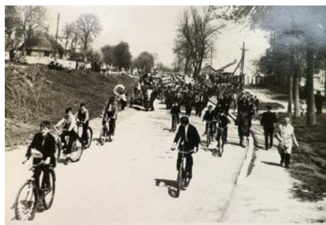
Przemarsz pochodu pierwszomajowego ulicą Wojsławską w latach 70. XX w.