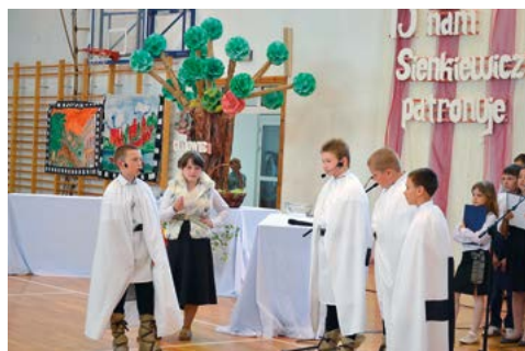
Inscenizacja w wykonaniu uczniów szkoły podstawowej