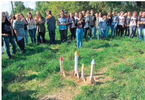
Eksperymenty młodych naukowców