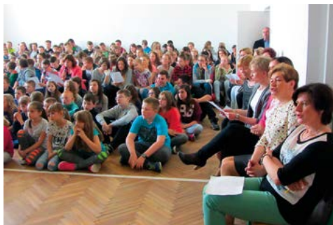
Bijemy rekord w jednoczesnym czytaniu fragmentu Potopu Henryka Sienkiewicza