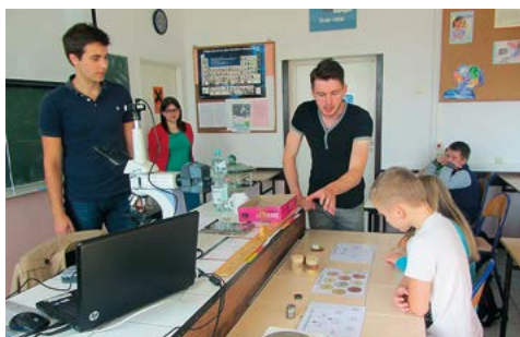
Lekcja ze studentami Politechniki Warszawskiej