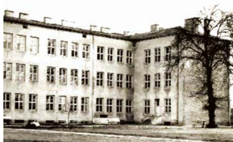
Widok szkoły z lat 70. XX w.