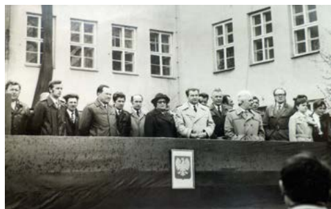
Władze lokalne podczas uroczystości pierwszomajowych na placu szkolnym