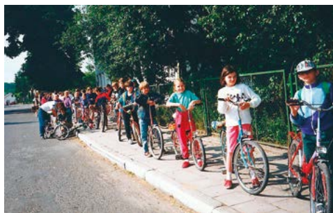
Wyjazd sprzed budynku szkoły na rajd rowerowy