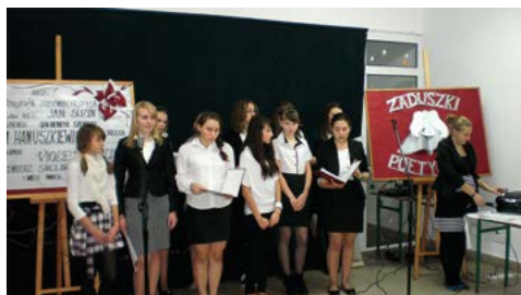
Zaduszki poetyckie 2012 r.