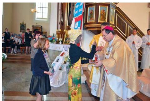
Jubileusz 15. lat nadania Zespołowi Szkół w Grabowcu imienia Henryka Sienkiewicza