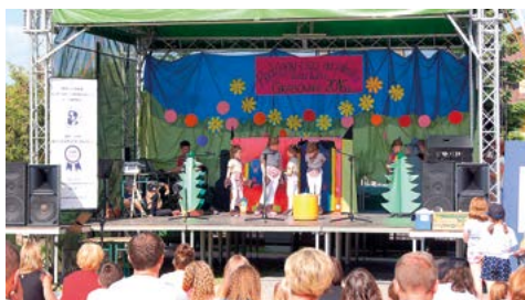
Przedstawienie Przygody niegrzecznej żabki w wykonaniu grupy teatralnej Śmieszki