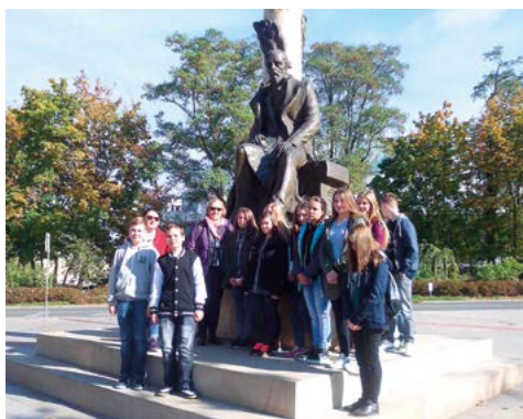
Wokół pomnika H. Sienkiewicza w Kielcach