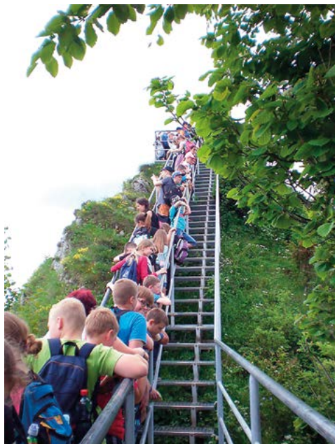
Wędrówka po pienińskich szlakach