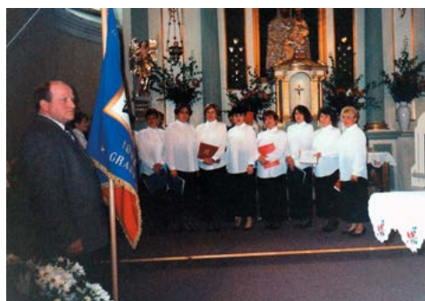
Poświęcenie sztandaru szkoły podczas uroczystej Mszy świętej

Uchwałą sejmową rok 2016 ogłoszono Rokiem Henryka Sienkiewicza, ponieważ przypada 170. rocznica urodzin Pisarza, 120. rocznica wydania powieści „Quo vadis” oraz 100. rocznica śmierci Noblisty. Zespół Szkół w Grabowcu mając za Patrona tego wybitnego Pisarza, włączył się w obchody Roku Jubileuszowego. Pierwszym działaniem naszym była zorganizowana sesja fotograficzna w scenerii sali kominkowej tzw. Starej plebani. Uczniowie klasy IIB i IIIA gimnazjum w kostiumach z epoki powieści historycznych Noblisty prezentowali wybrane postacie z „Ogniem i mieczem” oraz „Pana Wołodyjowskiego”. Innym nowatorskim działaniem była próba bicia rekordu Polski w jednoczesnym czytaniu fragmentu „Potopu”.