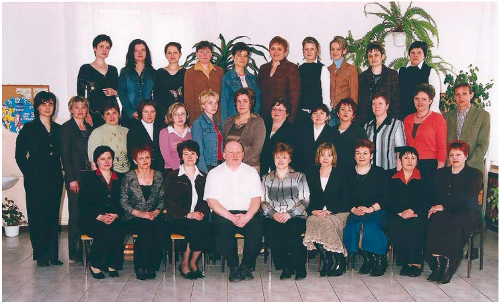
Kadra nauczycielska w roku szkolnym 2005-2006