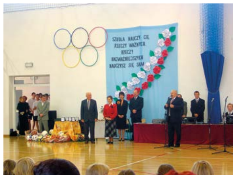
Uroczysta gala podczas otwarcia nowej hali sportowej