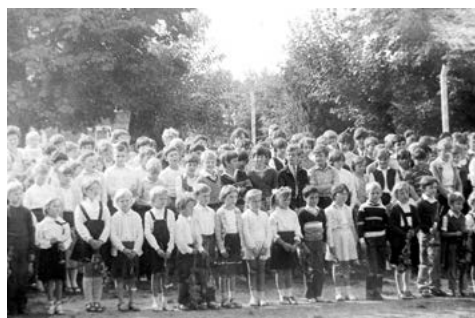
Rozpoczęcie nowego roku szkolnego – 1.09.1988 r.