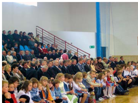
Zaproszeni goście podczas otwarcia hali 13.10.2006 r.