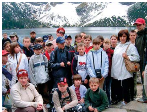
Wędrówka nad Morskie Oko