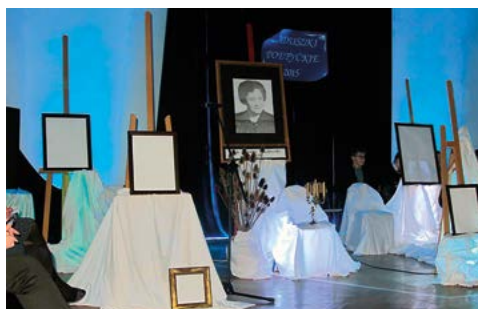
Zaduszki poetyckie 2015 r.