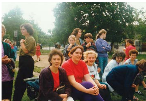
Rozgrywki sportowe na boisku szkolnym z okazji Dnia Dziecka