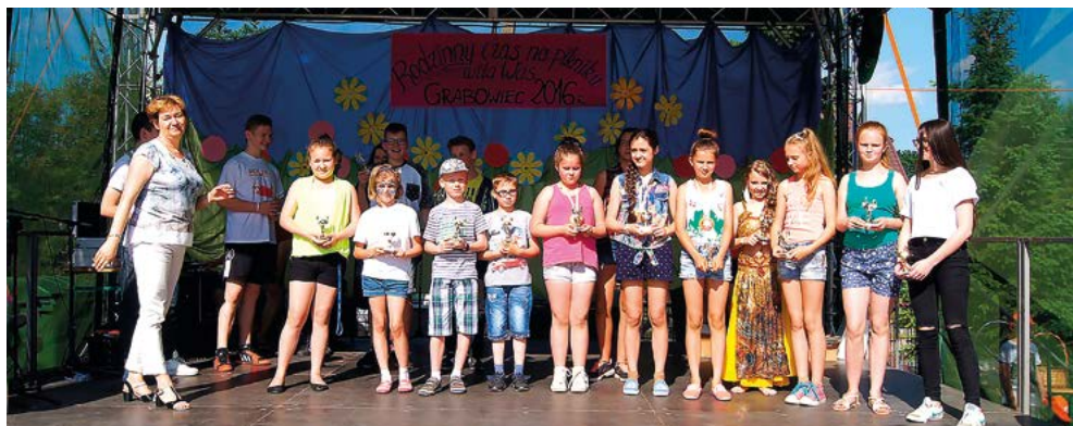
Zdobywcy statuetek Mistrz Talentu 2016