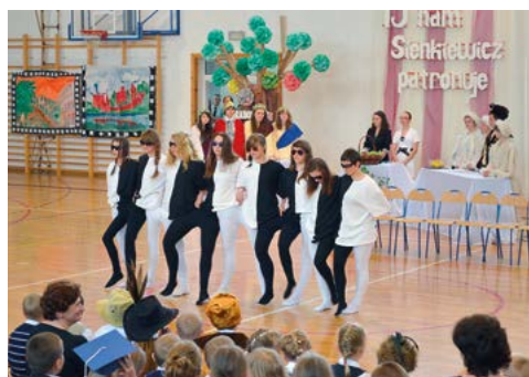
Układ taneczny na weselo