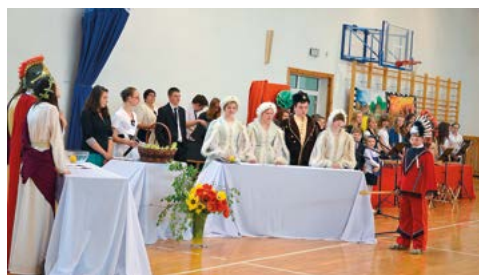
Quiz Kochał Cię Polsko – w wykonaniu uczniów gimnazjum