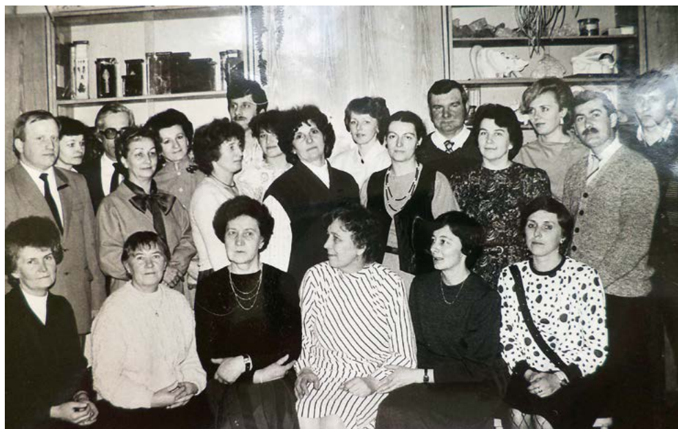
Grono pedagogiczne – 8.03.1989 r.