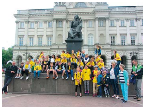
Przed pomnikiem Mikołaja Kopernika