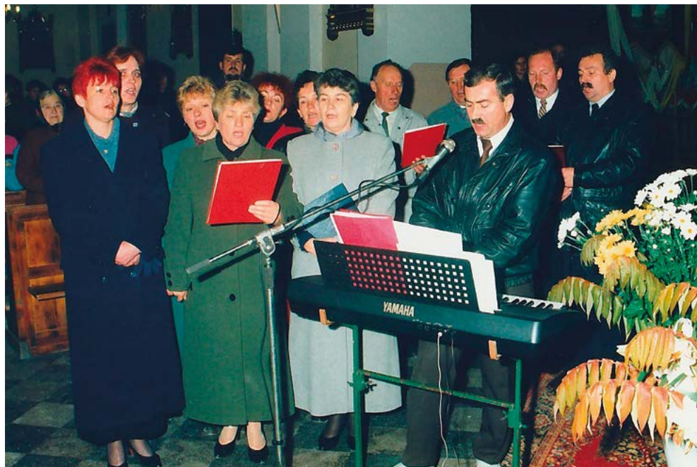
Recital Chóru w grabowieckim kościele parafialnym z okazji Dnia Edukacji Narodowej 14 października 1998 r.