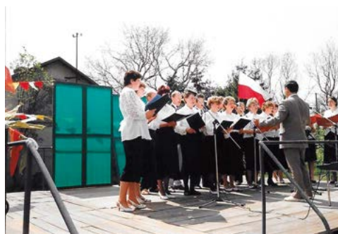
Debiut Chóru 3 maja 1993 roku przed budynkiem Gminnego Ośrodka Kultury w Grabowcu