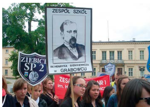
Ogólnopolski Zlot Szkół Senkiewiczowskich w Gnieźnie w 2013 r.