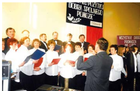
Prezentacja Chóru podczas oddania do użytku nowej części szkoły w 1997 roku