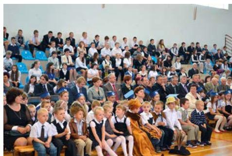
Uroczystości jubileuszowe – 5 maja 2013 r.