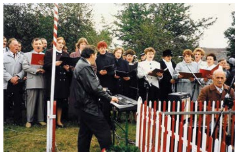
Występ Chóru Kantata podczas uroczystości rocznicowych w Grabowcu – Górze w 1996 r