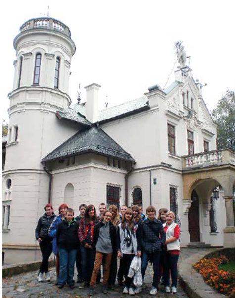
Wycieczka do Muzeum H. Sienkiewicza w Oblęgorku