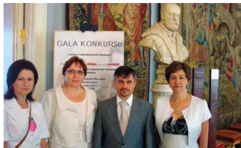
Gala Konkursu na Zamku Królewskim w Warszawie – czerwiec 2011