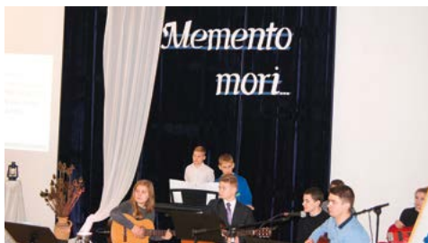
Zaduszki poetyckie 2014 r.