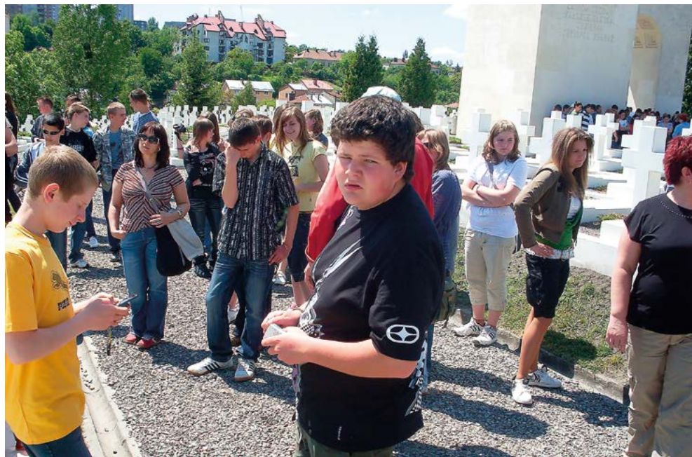
Na Cmentarzu Orłąt Lwowskich – 2009 r.