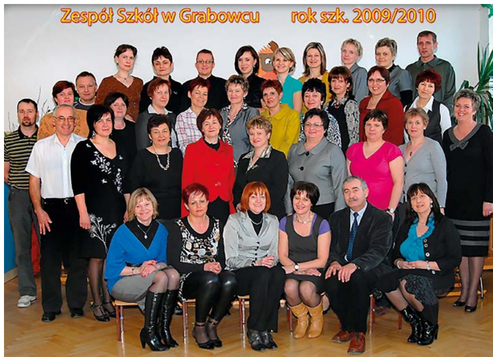
Kadra pedagogiczna w roku szkolnym 2009-2010