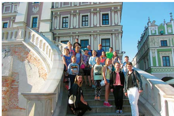
Zwiedzanie Zamościa z uczniami z zaprzyjaźnionej szkoły w Rostynianach na Litwie