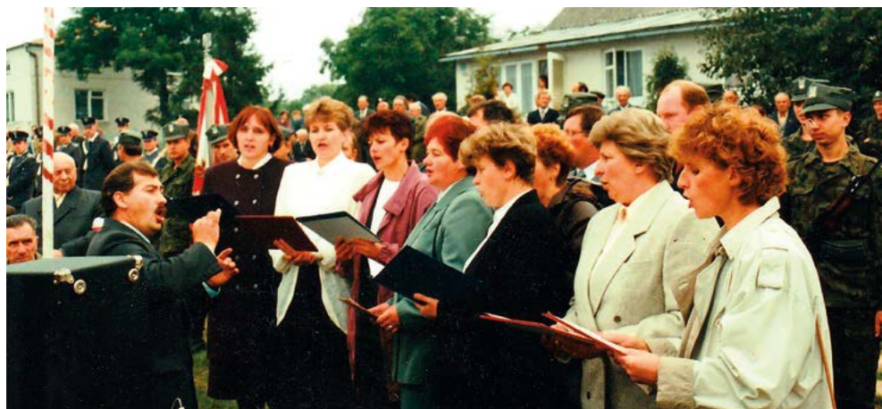
Występ Chóru Kantata podczas uroczystości rocznicowych w Grabowcu – Górze w 1995 r.