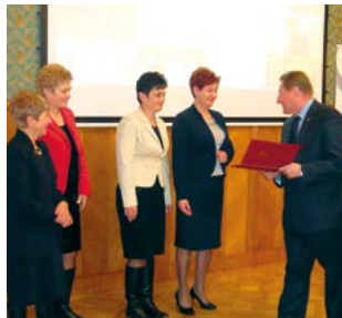
Wręczenie Certyfikatu Szkoły Promującej Zdrowie w Ministerstwie Edukacji Narodowej 10.12.2013 r