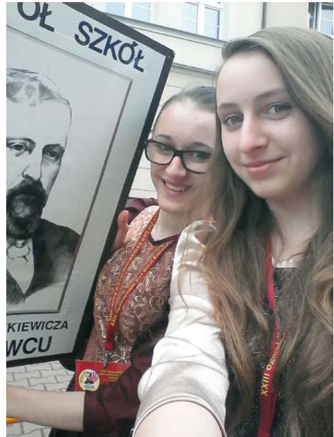
Złot w Przasnyszu – 2015 r.