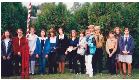
Młodzież gimnazjum podczas uroczystości w Grabowcu – Górze w 2001 r.