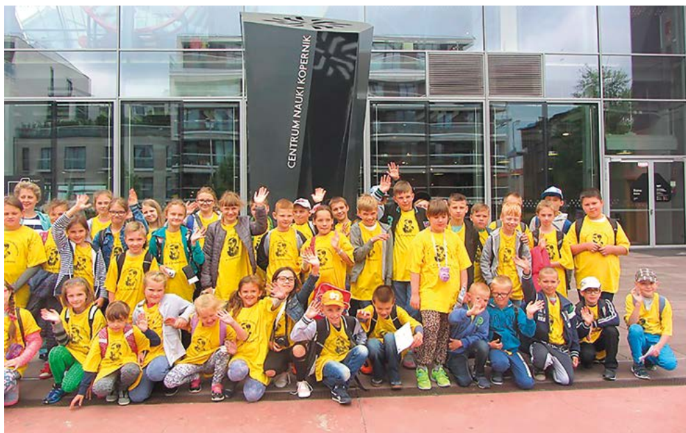
Zwiedzanie Centrum Nauki Kopernik w Warszawie