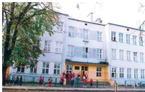
Widok szkoły z 1993 r.