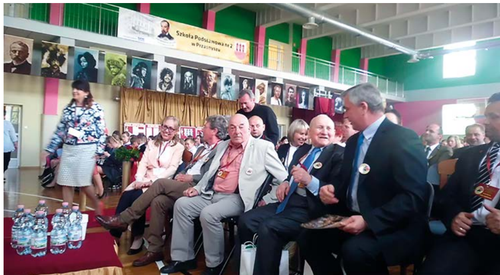
Goście honorowi Złotu w Przasnyszu