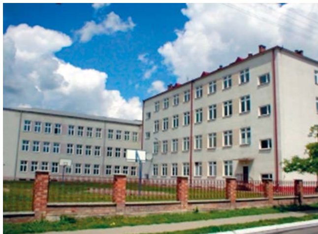
Fotografia szkoły z 2002 r.