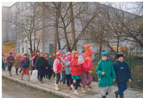
Barwny korowód wita wiosnę w 1992 r.