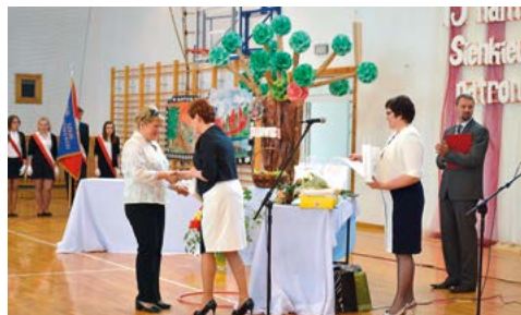
Dyrektor Zespołu wręcza nagrody za udział w konkursach senkiewiczowskich