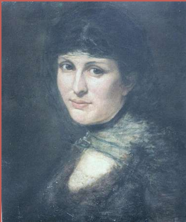
Portret kobiety w woalu