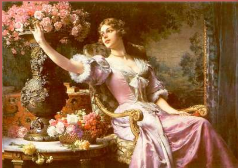
Dama w liliowej