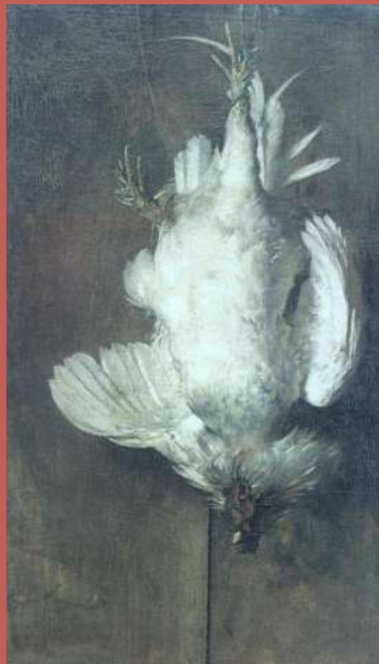
Martwa natura z kurą