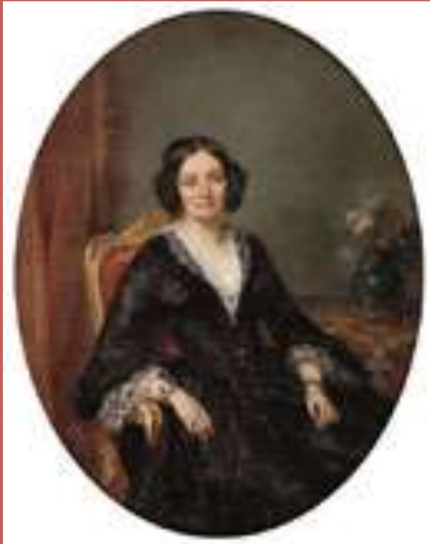
Portret damy w fotelu