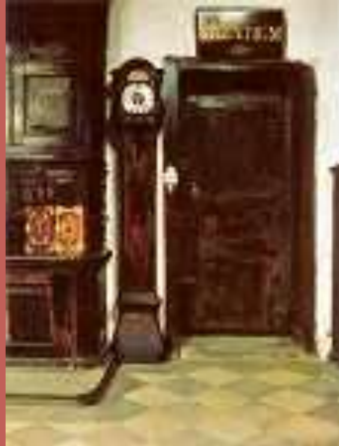
Wnętrze zakrystii silentium