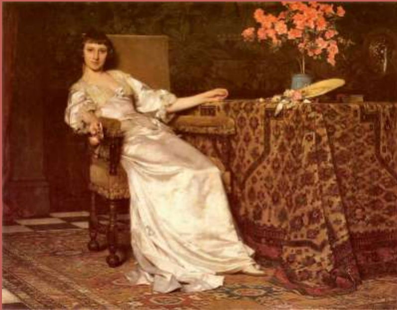
Dama z różą