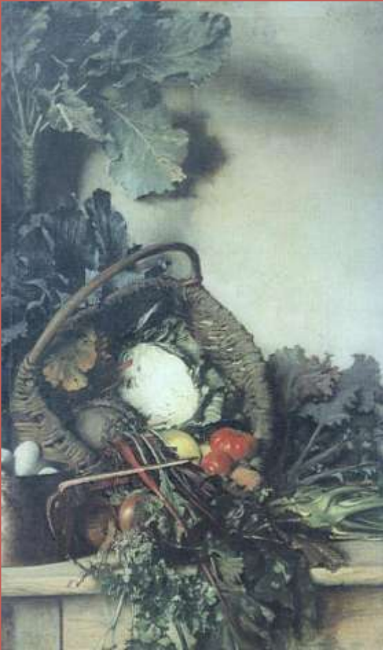
Martwa natura z jarzynami