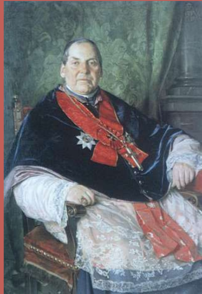
Portret biskupa Walentego Baranowskiego