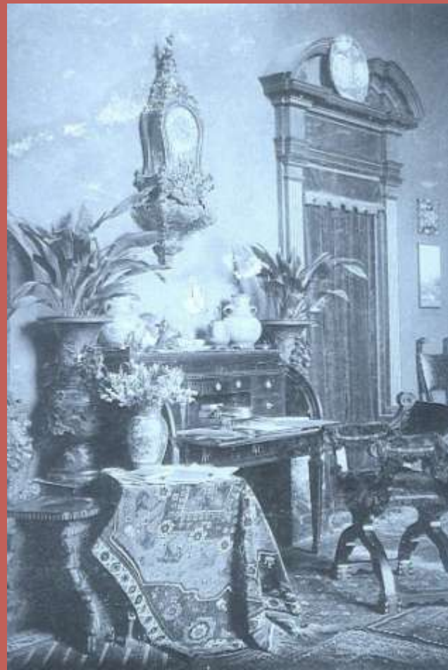
Wnętrze pracowni w Monachium