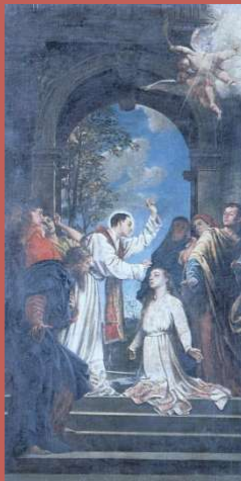
Cud św. Walentego