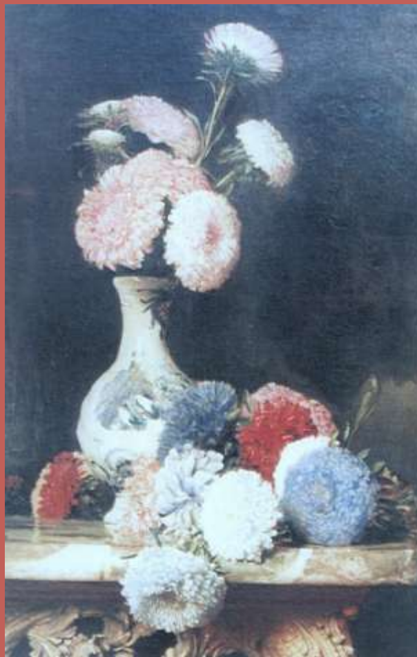
Astry w wazonie