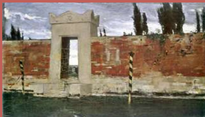
Cmentarz w Wenecji