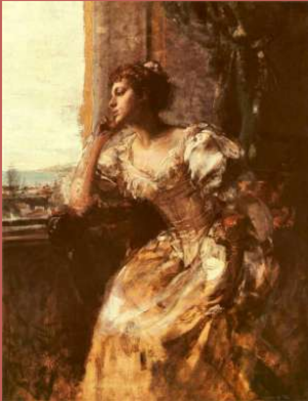
Dama przy oknie