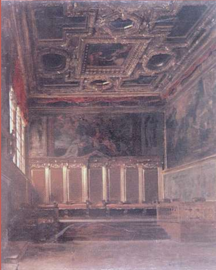
Sala Ambasciatorów w Pałacu Dożów w Wenecji