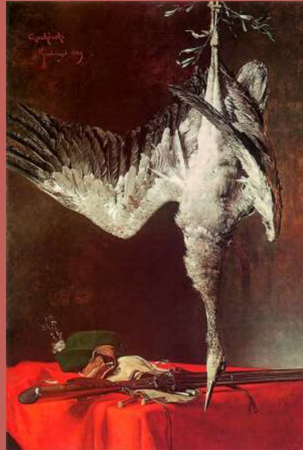
Martwa natura z czapłą