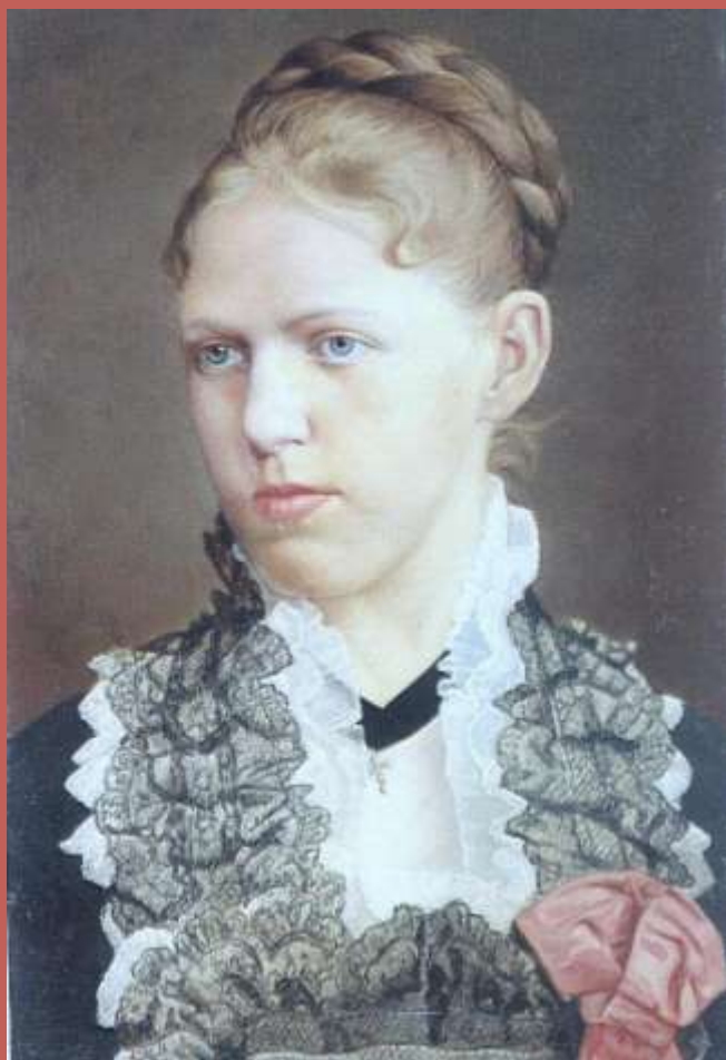
Portret młodej kobiety