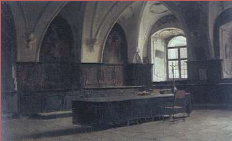
Wnętrze kościoła - Monasterium